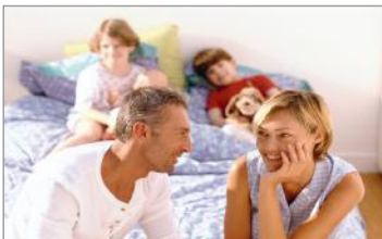
Genießen Sie Ihre Freizeit!

Ein mitreisender Angehöriger wird in einem ausländischen Krankenhaus stationär aufgenommen und eine Heimholung ist aus medizinischen Gründen erst in einigen Tagen möglich. Sie als Begleitperson wollen verständlicherweise vor Ort bleiben. Wir ersetzen die unplanmäßigen, also zusätzlich entstehenden Kosten für Hotelübernachtungen vor einem Krankentransport (oder einer Überführung), pro Tag bis zu 75,00, insgesamt bis zu maximal 375,00 zur Verfügung.