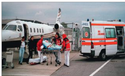
Von Krankenhaus zu Krankenhaus

Dieser ist nach einem normten Schema festgelegt, das in sieben Stufen eingeteilt ist, wobei z.B. Stufe 1 eine geringfügige Verletzung/Erkrankung bezeichnet und die Skala bis zu einer lebensgefährlichen Verletzung oder Erkrankung (Intensivstation) reicht. Somit ist der Schweregrad entscheidend für die Wahl des geeigneten Transportmittels und des Transportzeitpunktes. Dieser wird jedenfalls in Ihrem Interesse und zum medizinisch sinnvollsten Termin wahrgenommen.