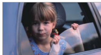
So kommen alle gut nach Hause

Erkrankt der Lenker eines Pkws in Kontinentaleuropa (ohne Inseln) so schwer, dass eine Heimholung durchgeführt werden muss, bringt ein erfahrener Berufschauffeur den Wagen in die Heimat zurück. Diese Kosten werden bis zu 2.000,00 übernommen.